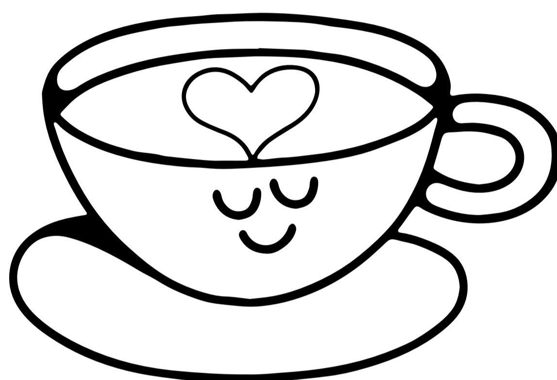
cappuccino flat white